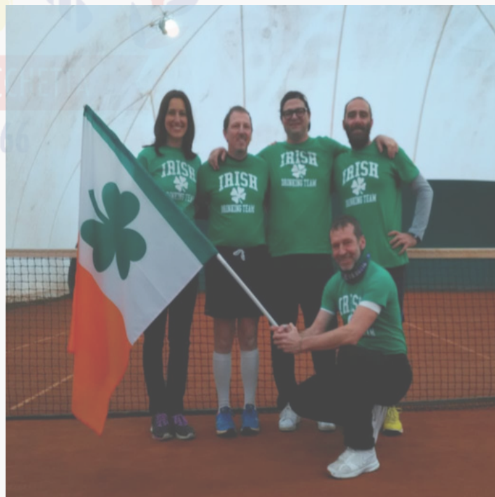
In foto: Irlanda, vincitrice del Torneo delle Nazioni 2019

Ogni squadra è composta da quattro uomini e una donna, con classifica limitata per garantire l'equilibrio della manifestazione, e rappresenterà una differente nazione: è proprio questo l'elemento "cool" del torneo, grazie al quale i giocatori si sono talmente immedesimati al punto da scendere in campo con i colori nazionali e presentarsi con i simboli e i costumi tipici della propria nazione.