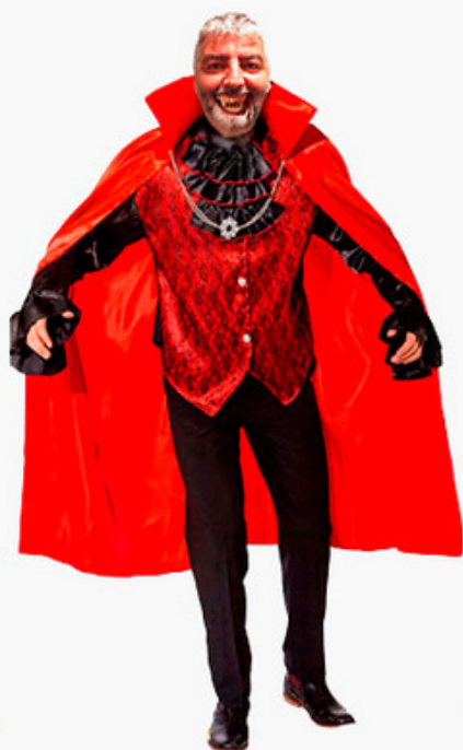
Francis SacConte Dracula

Otto le squadre ai nastri di partenza, suddivise in due gironi: la fase a gironi, in programma fino alla settimana precedente al Natale, qualificherà le prime tre per ogni raggruppamento ai play-off ad eliminazione diretta di gennaio: la squadra vincitrice, oltre ad aggiudicarsi il prestigioso "Trofeo delle Nazioni, sarà ospitata dal circolo alla cena finale dei festeggiamenti che si terrà a fine torneo. Interessante la formula "light" delle sfide: ogni incontro infatti è costituito da cinque partite tutte con punteggio "rodeo", il quale fa sì che in poche ore si deciderà l'esito del match grazie ad una formula rocambolesca ed entusiasmante.